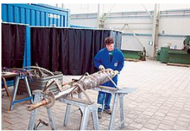
Kullanılmış şaftın komple bakımı