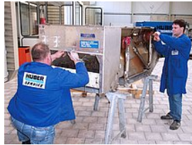
Başka bir üreticiden olan basamaklı ızgaranın bakım ve onarımı