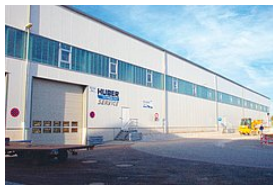
HUBER Fabrika Bakım Servisi