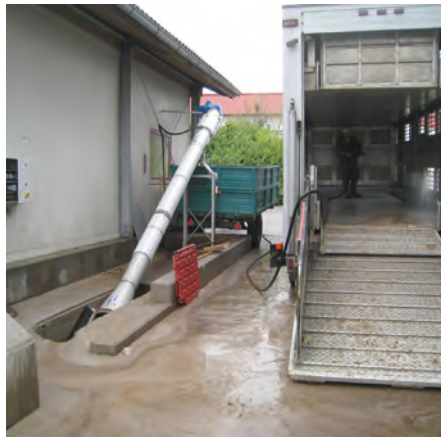
prozessspezifisch angepassten mechanischen Vorreinigung –