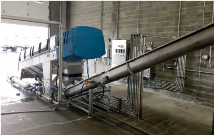
HUBER Schneckenpressen zur Schlammbehandlung – beste Entwässerungsleistung und höchste Volumenreduktion zur Senkung der Entsorgungskosten.