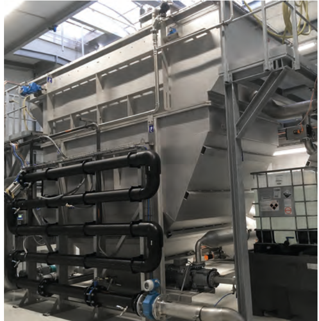
HUBER Druckentspannungsflotationen mit chemischer Vorbehandlung - Voll-, Teil- oder Nachreinigung industrieller Abwässer