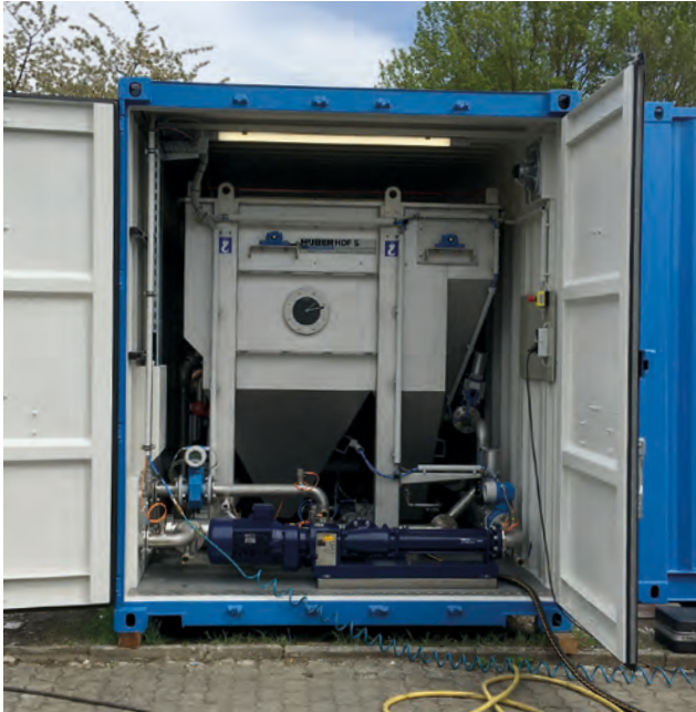
HUBER Anlagentechnik in Containerbauweise – Flotationen oder Schlammwässerungen ohne Bauarbeiten – sofort einsatzbereit.