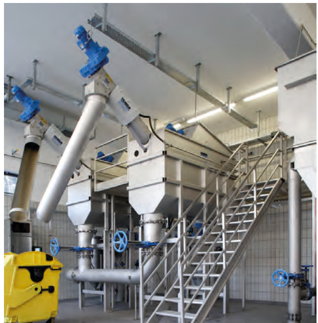
HUBER Siebanlage ROTAMAT® Ro2 mit Hochdruckreinigung – beste Reinigungsergebnisse und angepasste Maschinenteknik.