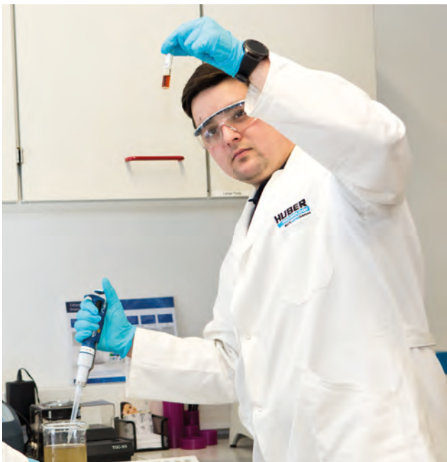
Voruntersuchungen im Labor oder direkt vor Ort zur Ermittlung der Betriebsparameter und Ablaufwerte – Sicherheit für Kunden und Betreiber.