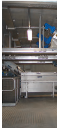
HUBER Rechen- und Siebsysteme zur bestmöglichen und projek effizient, langlebig und vielfach erprobt.