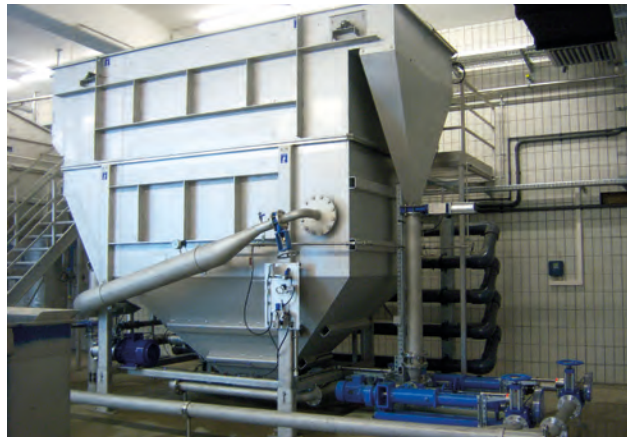
HUBER Druckentspannungsflotation zur physikalisch-chemischen Vorreinigung – optimale Reduktion von CSB, Fetten und Feststoffen, mehr als 500 Installationen weltweit.